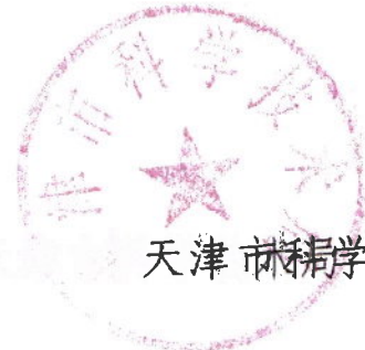
天津市科学技术局